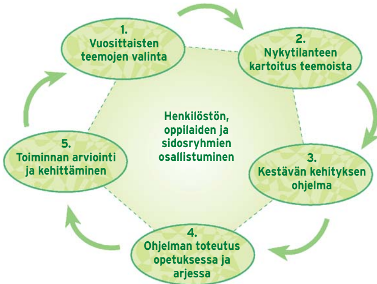
Kuva 3. Kestävän kehityksen ohjelman rakentaminen ja päivittäminen teemojen avulla.

24 Henkilöstö ja oppilaat osallistuvat arviointitiedon käsittelyyn ja sitä hyödynnetään kestävän kehityksen ohjelman päivittämisessä sekä opetuksen ja toimintakulttuurin kehittämisessä. Koulu raportoi sidosryhmilleen kestävän kehityksen työn tuloksista.