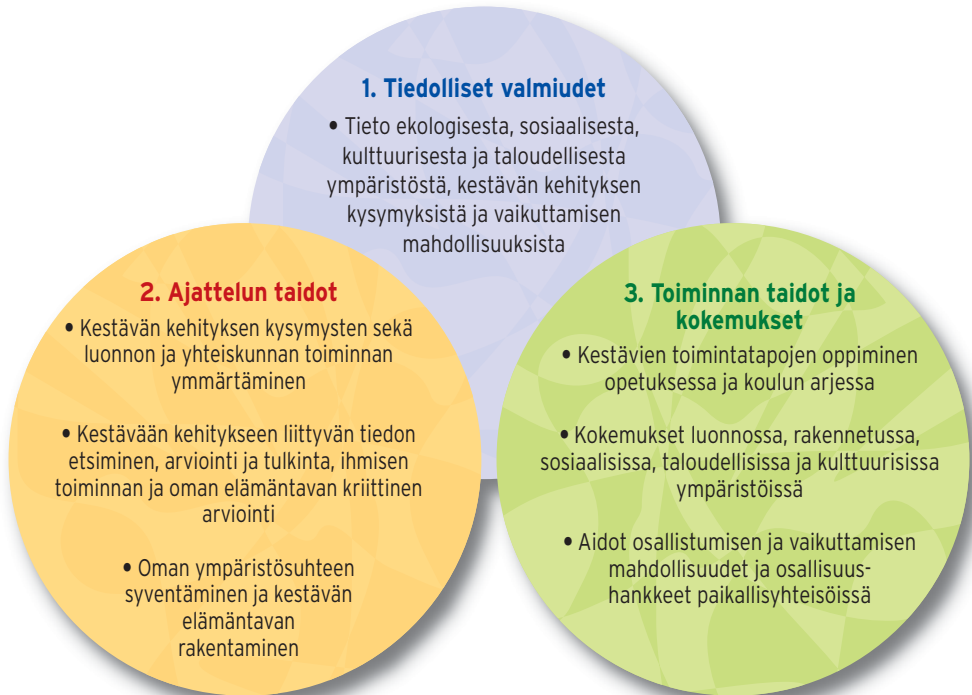
Kuva 2. Opetuksen toteutuksen kriteerien laadinnassa käytetyn kestäväan kehityksen kasvatuksen mallin osia ovat tiedolliset valmiudet, ajattelun taidot sekä toiminnan taidot ja kokemukset.

Kestäväan tulevaisuuden rakentamisessa tärkeintä ei ole kuitenkaan olemassa olevan tiedon oppiminen, vaan tiedon käsitteilyyn ja muutoksen aikaansaamiseen liittyvien valmiuksien eli ajattelun taitojen omaksuminen. Monimutkaisten kestäväan kehityksen kysymysten ymmärtäminen edellyttää kokonaisuuksien ymmärtämistä, jolla tarkoitetaan muun muassa luonnonjärjestelmien, teknologian, talouden ja yhteiskunnan toiminnan sekä ihmisen ja luonnon välisten vuorovaikutussuhteiden hahmottamista kokonaisuuksina.