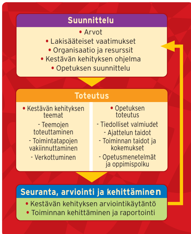
Kuva 1. Kestävän kehityksen kriteerien rakenne perustuu laadunhallinnasta tuttuun jatkuvan parantamisen ajatteluun.