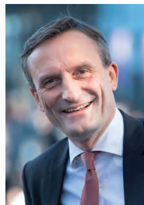
Thomas Geisel Oberbürgermeister der Landeshauptstadt Düsseldorf